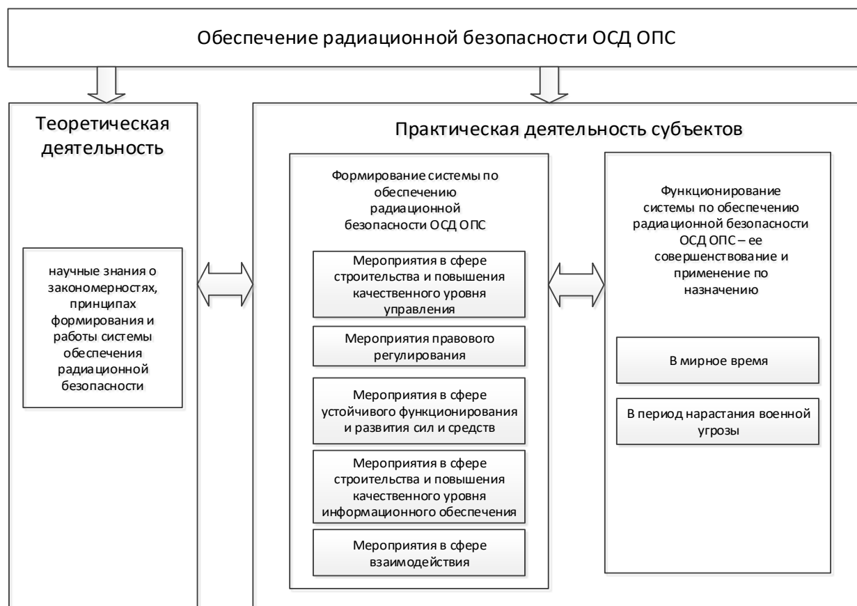
Рисунок 1. – Структура деятельности по обеспечению РБЗ ОПС

Исходя из задач республиканской системы обеспечения радиационной безопасности [6], охраны Государственной границы Республики Беларусь [7], положений нормативных правовых актов Республики Беларусь по вопросам обеспечения радиационной безопасности персонала и населения, порядок обеспечения радиационной безопасности ОСД ОПС целесообразно разделить на группы мероприятий, как показано на рисунке 1.